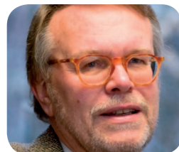
Table ronde : La relation citoyenne à l'heure des TIC

Sa carrière d'une quinzaine d'année chez Electronic Arts, leader mondial dans le domaine des loisirs interactifs, l'a dotée d'une connaissance approfondie des secteurs des nouvelles technologies et de l'entertainment au niveau international. Elle soutient aujourd'hui l'émergence de nouveaux segments stratégiques pour le développement économique de la Communauté Urbaine de Lyon tout en poursuivant sa carrière au sein du groupe GL-Events.